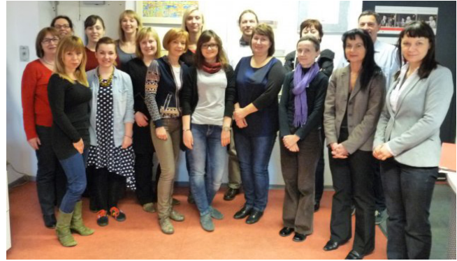
BERLIN, NJEMAČKA (8.-9. TRAVNJA 2014)