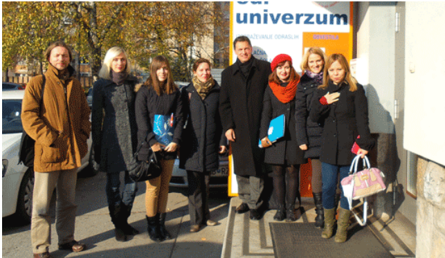
LIUBLIANA, SLOVĒNIJA (2013 M. GRUODŽIO 2-3 D.)