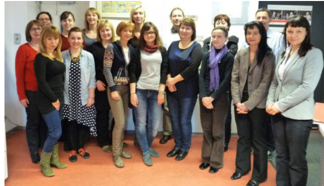
BERLIN, NEMČIJA (8.-9. APRIL 2014)